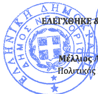
Μέλλιος Αθανάσιος Πολιτικός Μηχανικός